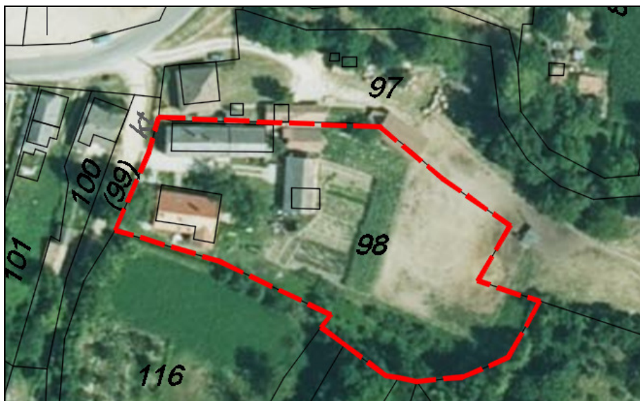
Helyszínrajz és Ortofotó 2018.

A tájház a Vár út 35. sz. címen a belterület 98 hrsz. telken helyezkedik el. Maga a Vár út ezen szakaszának vonalvezetése, illetve a telket feltáró 99 hrsz.-ú köz is különleges, történelmi szerkezet. A telek nagy méretű (4100 m 2 ), azaz nem „elaprózódott” korai telekosztás eredménye. A telek közelében van az Aranyosi patak és annak hidja a Vár úton, melyek szintén a település azonosságához kötődő elemek.