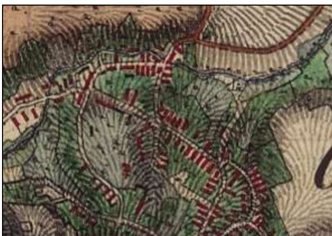
II. katonai felmérés

A 13/2017 (XII.29.) önkormányzati rendelettel jóváhagyott településkép védelméről szóló rendelet jelenleg nem határoz meg helyi védettséget épületekre vonatkozóan. Legutóbb a településrendezési terv 2020-ban készült örökségvédelmi alátámasztó munkarésze vette számba vette a község épített értékeit. Ilyenek a népi építészeti lakóházak, melyek a török kor utáni, akár a 17-18 századi korábbi beépítéseken, alapokon nyugvó, jellemző képüket tekintve a 19-20 században épült lakóépületek, hosszú „parasztházak”. Ezek ugyan sehol nem alkotnak egybefüggő utcaképet, de a település történetének meghatározó tanúi, a településkép karakteres eleme. Közülük a régebbi, egységes és eredetihez közeli kialakításban megmaradt, jó állapotú épületek közé tartozik a Tájház (Falumúzeum) épülete. A funkció és építészeti érték egyik legjobban működő egységéről van szó, a tájházban bemutatott tárgyak, információk a falu múltját, öntudatát jelenik.