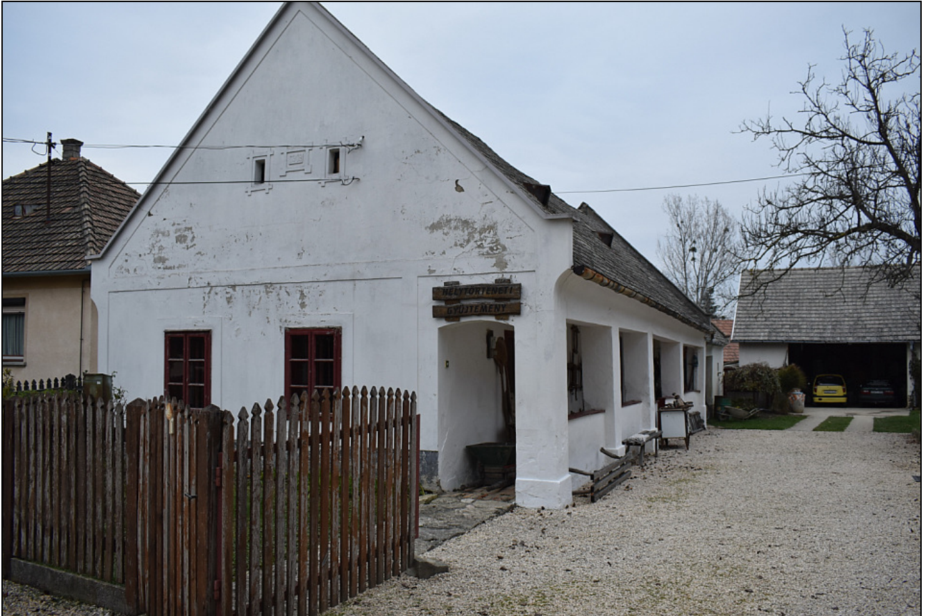
Csesznek Vár utca 35. Falumúzeum

A tájház a Vár út 35. sz. címen a belterület 98 hrsz. telken helyezkedik el. Maga a Vár út ezen szakaszának vonalvezetése, illetve a telket feltáró 99 hrsz.-ú köz is különleges, történelmi szerkezet. A telek nagy méretű (4100 m 2 ), azaz nem „elaprózódott” korai telekosztás eredménye. A telek közelében van az Aranyosi patak és annak hidja a Vár úton, melyek szintén a település azonosságához kötődő elemek.