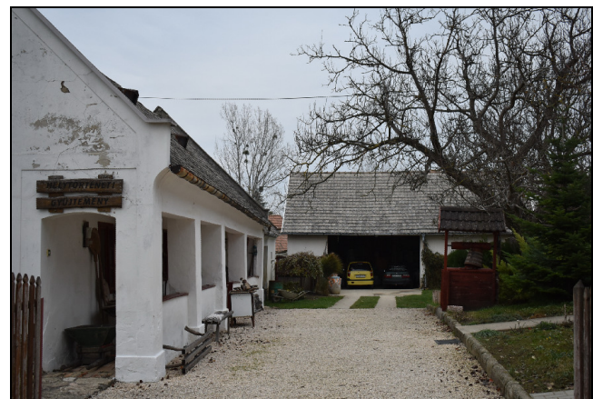
Csesznek Vár utca 35.